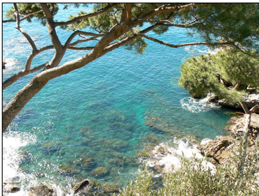
Fondazione Bogliasco – Villa dei Pini

Info: tel 019 883914 - villagroppallo@libero.it