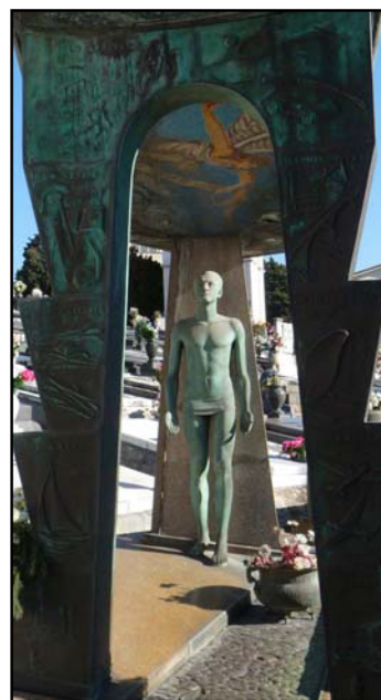
La Spezia, cimitero di Cà di Boschetti Tomba Bargiacchi Tognelli

Info: tel. 0187 66811 - sba-lig.museoluni@beniculturali.it